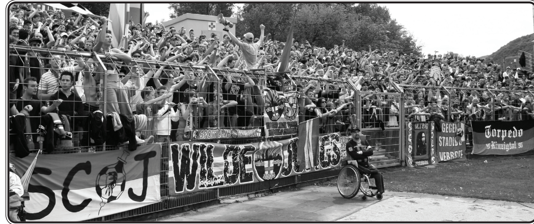
Wieder mal prall gefüllter Gästeblock. Ein Vorgeschmack auf so manches Spiel nächstes Jahr

gelassen die Erstklassigkeit feierten. Zwar spielte dann ausgerechnet bei uns im sonst so sonnigen Süden das Wetter den Spielverderber, aber das hinderte einige nicht daran, die Feierlichkeiten noch bis weit in die Nacht fortzusetzen, sodass man am nächsten Tag den ein oder anderen mit Kater antraf.