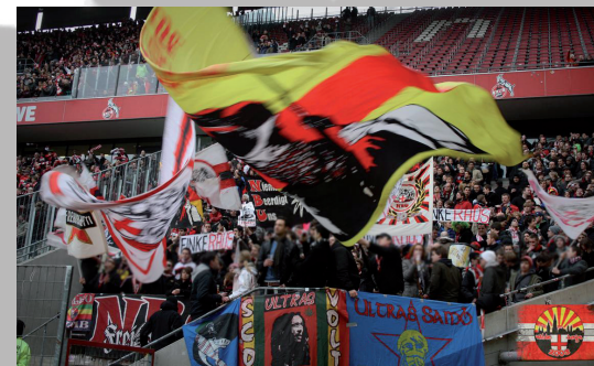
Trotz der vielen Fahnen herrschte eher mäßige Stimmung im Gästeblock.

Außer Spesen nichts gewesen. So oder so ähnlich könnte man das Auswärtsspiel in Köln charakterisieren. War man doch frohen Mutes in die Karnevalsmetropole gereist; fest im Glauben verankert, dass dort der Klassenerhalt - die magischen 40 Punkte - gesichert werden können. Doch an diesem Spieltag sollte das einfach nicht sein. Köln gewann 1:0 und das alles andere als unverdient. Bereits in der ersten Halbzeit hatte Köln zwei Großchancen, die fast schon einen Rückstand zur Halbzeitpause bedeutet hätten. Doch Köln traf maximal den Pfosten oder scheiterte am wieder mal guten Oliver Baumann. Viel sorgte im Gästeblock zu diesem Zeitpunkt nicht für Erheiterung - allenfalls die Kölner Chancenverwertung zauberte dem ein oder anderen mal kurz ein Lächeln auf die Lippen. In der zweiten Halbzeit war Köln zwar weiterhin die bessere Mannschaft, jedoch kam auch der SC zu ein paar guten Chancen und sogar zu einem Tor! Unser Toptorjäger Papiss Demba Cissé beförderte den Ball über die Linie, leider aber nach Meinung des Schiedsrichters nicht ganz Regelkonform und so wurde das Tor zum Leidwesen aller SC Fans nicht gegeben. Stattdessen traf kurz vor Schluss noch „Prinz Poldi“ mit einem - zugegeben schönen - Heber zum 1:0 Endstand. Eine durchaus bittere last-minute-Niederlage. Aber vielleicht können wir ja heute einen last-minute-Sieg bewundern und anschließend mit 40 Punkten auf dem Konto den Heimweg antreten?